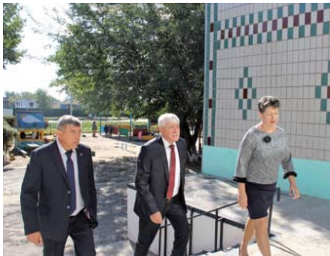
Во время поездки по детским садам