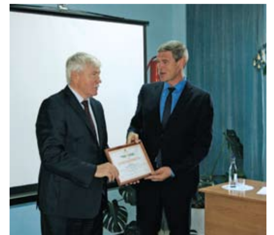
Вручение благодарности СПК «Дружба» за достижение успехов в сфере развития сельских территорий