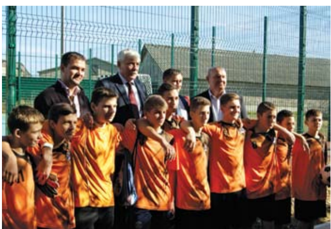
Верхнемакеевская футбольная команда