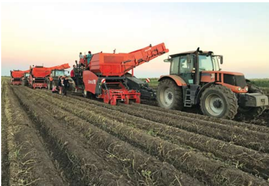
Упорный труд ведёт к победе.

– Урожайность картофеля – 30 тонн с гектара. Это средняя урожайность, учитывая погодные условия. На сегодняшний день они уже 5000 тонн получили, а получат 9000 тон с этой площади. Урожайность на уровне прошлого года. Нормальный, стабильный урожай. А что касается вала, то если в прошлом году они посадили около 200 гектаров, то сейчас около 300 гекта-