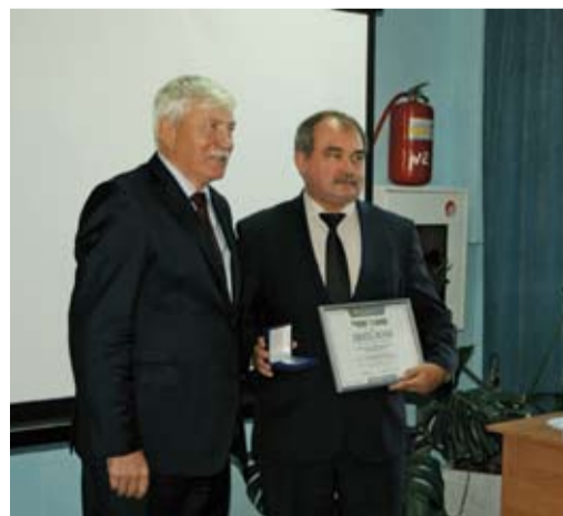
Вручение диплома администрации Шолоховского района Ростовской области