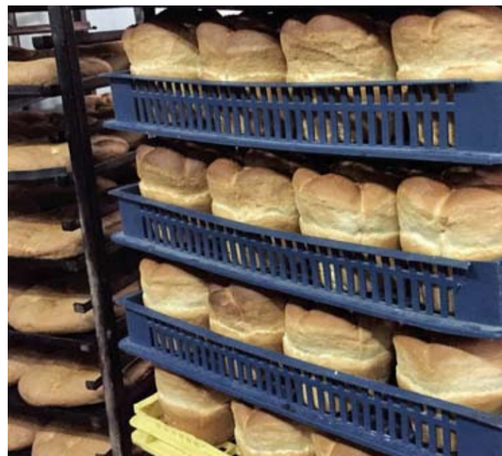
Настоящий донской хлеб