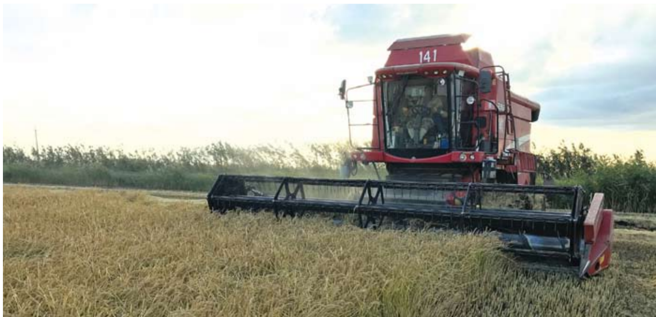
Уборочная идёт успешно