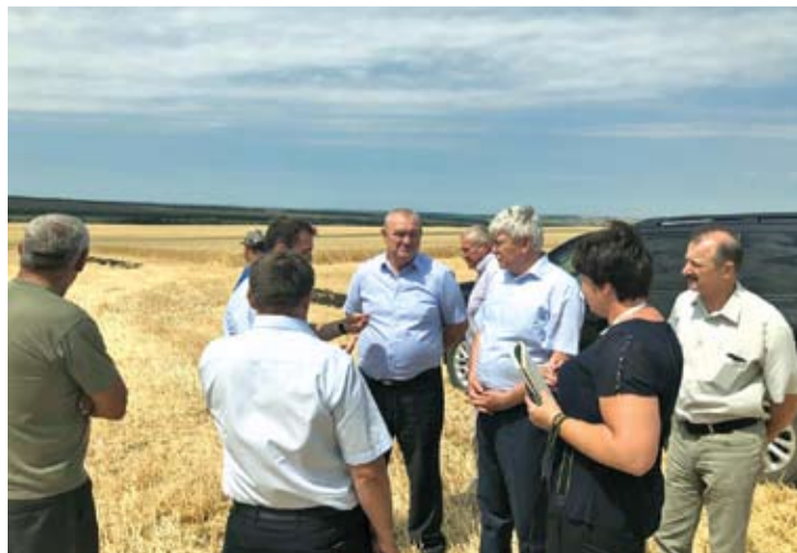
На встрече с аграриями