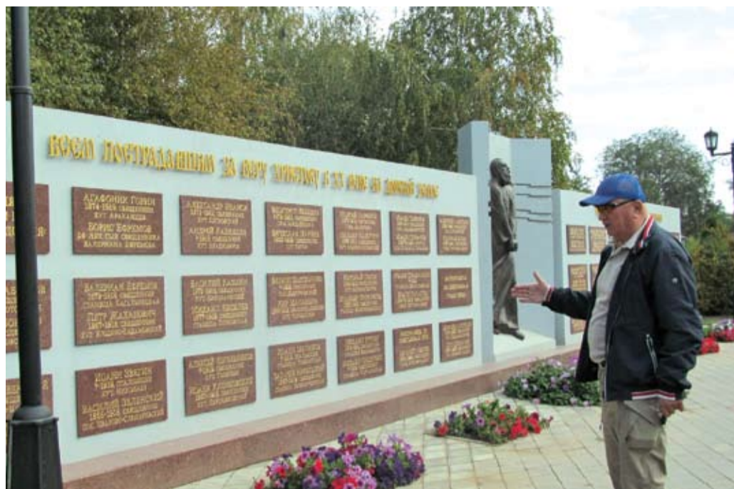
Мемориал в Пролетарске