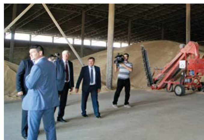
Склад напольного хранения ООО «Светлый»